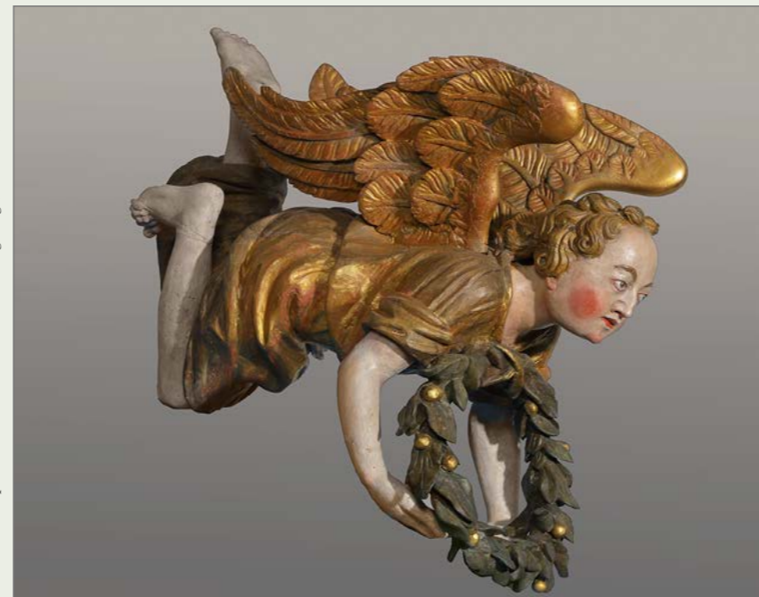
Anioł chrzcielny leżący, XVIII w. Muzeum Pomnika Historii „Frombork Zespół Katedralny” Pierwotnie - Ostpreussisches Provinzialmuseum Königsberg (Królewiec)

i Zmartwychwstania (1930) z kościoła ewangelickiego w Jerutkach (obecnie z Parafii Ewangelicko-Augsburskiej w Ostródzie), XV-wieczny włoski obraz Zmartwychwstanie Chrystusa oraz XVII-wieczny tryptyk fundacyjny z Parafii Ewangelicko-Augsburskiej w Nidzicy, XVII-wieczny malowany konfesjonał ze zbiorów Muzeum Mikołaja Kopernika we Fromborku, XVIII-wieczne malowane drzwi przedstawiające Człowieka , Czas i Śmierć i przedpiersie balustrady ławy prowizorów (1746) ze scenami biblijnymi z Muzeum Archeologiczno-Historycznego w Elblągu.