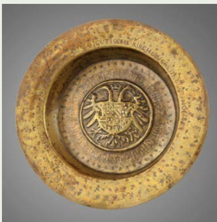
Misa chrzcielna, fundacja Eutrozyny von Borck, 1685 Parafia Ewangelicko-Augsburska, Ostróda (Osterode) Pierwotnie - kościół ewangelicki w Łęgutach (Langgut)