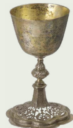
Kielich, 1636 fundacja C. F. Von der Oelesnitz Parafia Ewangelicko-Augsburska, Nidzica (Neidenburg)

ewangelickiego), czy portret Tymoteusza Gizewiusza (ok. 1810) z Muzeum Mazurskiego w Szczytnie.