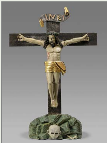
Krzyż, XVII w. Parafia Ewangelicko-Augsburska, Ketrzyn (Rastenburg)