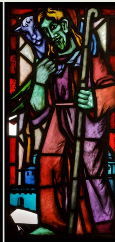
Skrzydła okienne z witrażami o tematyce chrystologicznej: Narodzenie Chrystusa, Chrystus Dobry Pasterz, Niesienie Krzyża, Zmartwychwstanie Pracownia Emilia Krügera, Królewiec 1930. Fundacja Johann Makowka, Charlottenburg Parafia Ewangelicko-Augsburska, Ostróda (Osterode) Pierwotnie - kościół ewangelicki w Jerutkach (Klein Jeruten)