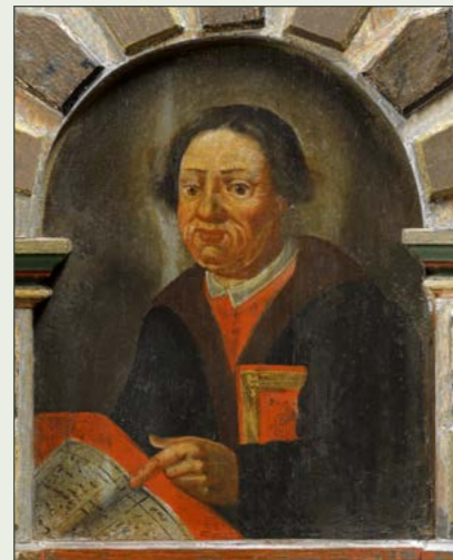
Drzwi do ambony z portretem Marcina Lutra, 1647 Kościół rzymskokatolicki p.w. Matki Boskiej Zwycięskiej, Łabędnik. Pierwotnie - kościół ewangelicki w Łabędniku (Gross Schwansfeld).