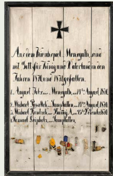
Tablica ofiar z parafii Mensguth (Dzierżążki), podjętych w wojnie 1870-1871 za Boga, króla i ołtarzy Parafia Ewangelicko-Augsburska w Dzierżążkach (Mensguth), filiał Parafii Ewangelicko-Augsburskiej w Pasymiu (Passenheim)

Wszystkie obiekty prezentowane na ekspozycji wypożyczono z kościołów ewangelicko-augsburskich, kościołów ewangelicko-metodystycznych, kościołów rzymskokatolickich będących przed wojną kościołami ewangelickimi, ze zbiorów Muzeum Mikołaja Kopernika we Fromborku, Muzeum Pomnika Historii „Frombork Zespół Katedralny”, Muzeum Archeologiczno-Historycznego w Elblągu, Muzeum Mazurskiego w Szczytnie (Oddział Muzeum Warmii i Mazur w Olsztynie), Archiwum Diecezjalnego w Elblągu i zbiorów prywatnych.