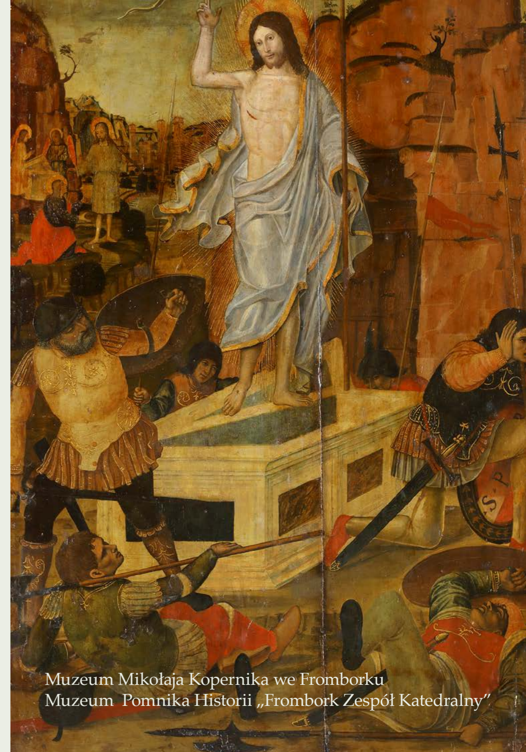
Muzeum Mikołaja Kopernika we Fromborku Muzeum Pomnika Historii „Frombork Zespół Katedralny”