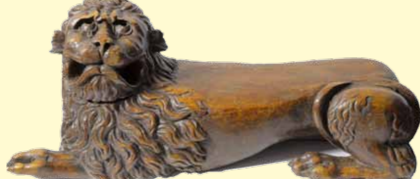
Lew - stopień stali, 1396 r. Kolegiata p.w. Najświętszego Zbawiciela, Dobre Miasto

By stworzyć maksymalnie wszechstronny obraz sztuki powstającej na terenie diecezji zaprezentowano również kilka nastaw ołtarzowych (całych jak i ujętych fragmentarycznie) stanowiących z jednej strony doskonały przykład rozwoju, ale też odrębności formy i struktury tutejszych retabulów, z drugiej strony pozwalających prześledzić proces ewolucji przedstawień ikonograficznych od późnego średniowiecza do początku wieku XX. Do najstarszych obiektów należą pochodzące z XV i XVI wieku skrzydła z ołtarza głównego kościoła p.w. Matki Boskiej Zwycięskiej w Łąbądku. O formach manierystyczno-barokowych świadczą skrzydła ołtarza głównego z kościoła p.w. św. Barbary w Boguchwałach, zaś przełom XIX i XX wieku reprezentuje nastawa ołtarzowa z kościoła p.w. św. Jana Chrzciciela w Jonkowie.