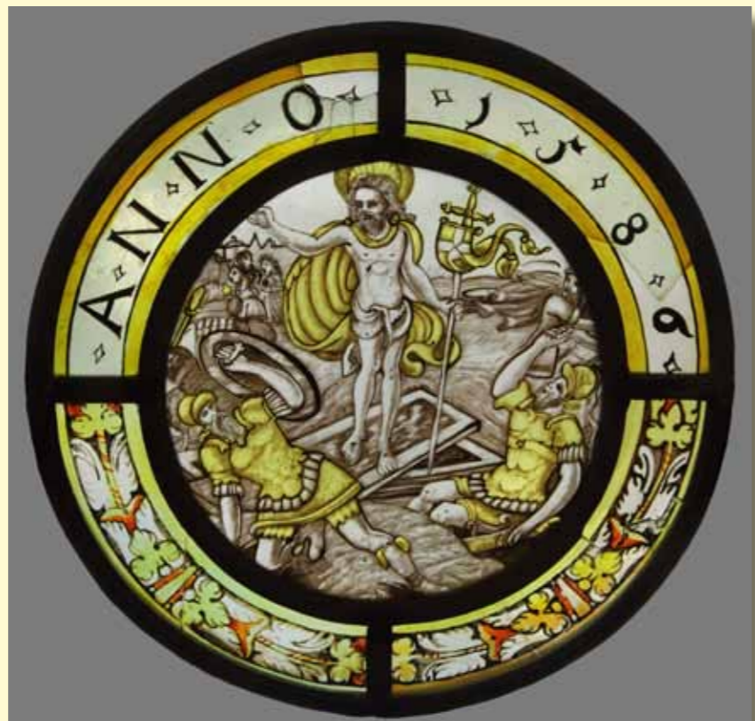
Witraż z datą 1586. Kościół p.w. św. Anny w Jonkowie w Gudniarach

Malarstwo reprezentują zarówno dzieła wielkoformatowe („Pokłon Trzech Króli” i „Boże Narodzenie” z kościoła św. Piotra i św. Pawła w Lidzbarku Warmińskim, „Madonna Apokaliptyczna” z Wyższego Seminarium Duchownego Hosianum